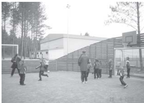
Teho- ja supertyttöjen harjoitukset aamulla kello 7.36