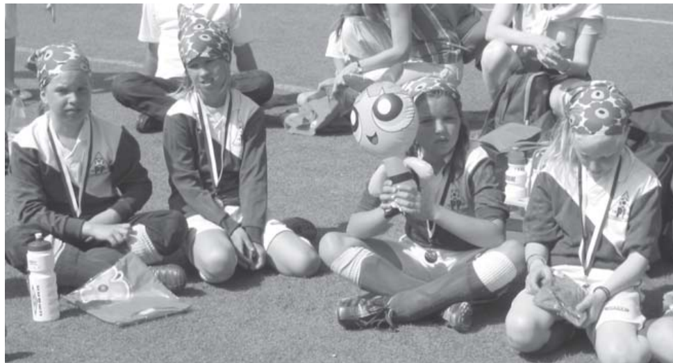
Rankan turnauksen jälkeen mitalit kaulassa