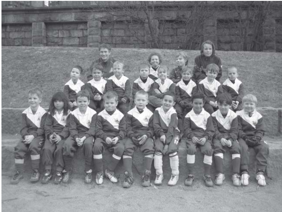
Kuva on joukkueen harjoituksista Johanneksen kentältä kesältä 2005.

Joukkue tulee osallistumaan kesän aikana noin kuuteen peli-iltaan ja yhteen turnaukseen. Harjoituksissa keskitytään edelleen henkilökohtaisten perustaitojen kehittämiseen ja ryhmässä toimimiseen. Uudet pelaajat ovat tervetulleita joukkueeseen.