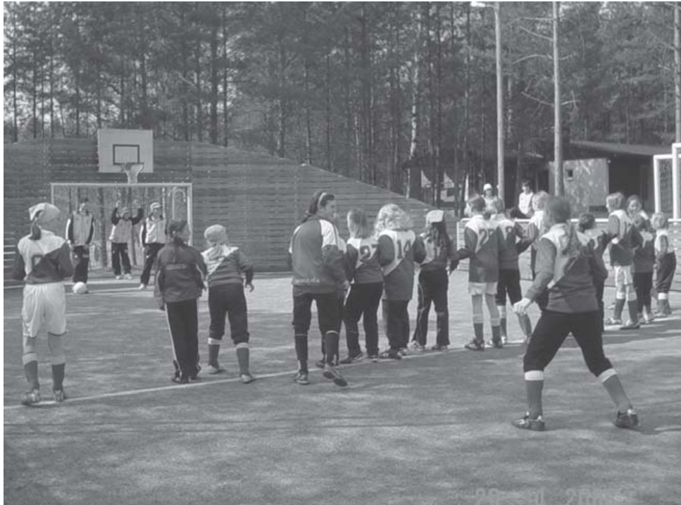
16 Hyökkääjää ja 1 puolustaja

PPJ:n tyttöjoukkueet olivat viimeistelyleirillä ennen piirisarjan alkua Eerikkilässä. Salama-, Teho- ja Supertyttöjen yhteisellä leirillä oli vajaa 30 innokasta pelaajaa ikäluokista 93-99.