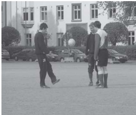
Alkulämpö à la Edustusjoukkue

Kuluvalla kaudella treenataan kolmesti viikossa ja koitetaan nousta neloseen. Tätä kirjoittaessani kausi on hurautunut hyvään käyntiin. Aloitimme tahnaisesti, koska meiltä puuttuivat totutut esipelit