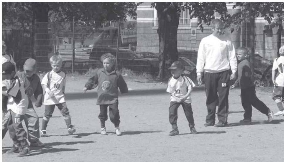
Harjoituksia varten fudiskoululaiset jaetaan pienryhmiin, jotta kaikki osallistuvat peleihin ja leikkeihin.