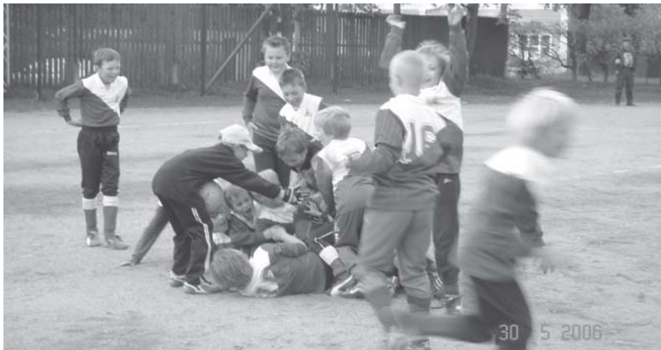
Kuvassa PPJ-97 pojat riemuitsevat ensimmäisestä voitostaan 31.5.2006

Tällä uudella joukkueella menimme rohkeasti Palloliiton järjestämiin piirisarjamatseihin mukaan. Peli- ja treenikokemusta ei ollut vielä kertynyt kovinkaan paljon, mutta matsit ovat kuitenkin menneet mukavasti. Tappioitakin on tullut, mutta pelaaminen on näyttänyt hyvältä ja joukkue on kehittymässä hyvää vauhtia kovaksi vastustajaksi.