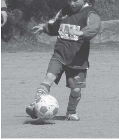
Tytöt pärjäivät fudiskoulussa erittäin hyvin poikien mukana