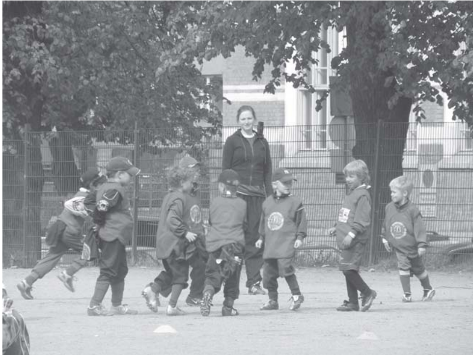
Loppupelejä odoteltiin jo päivän alusta lähtien.