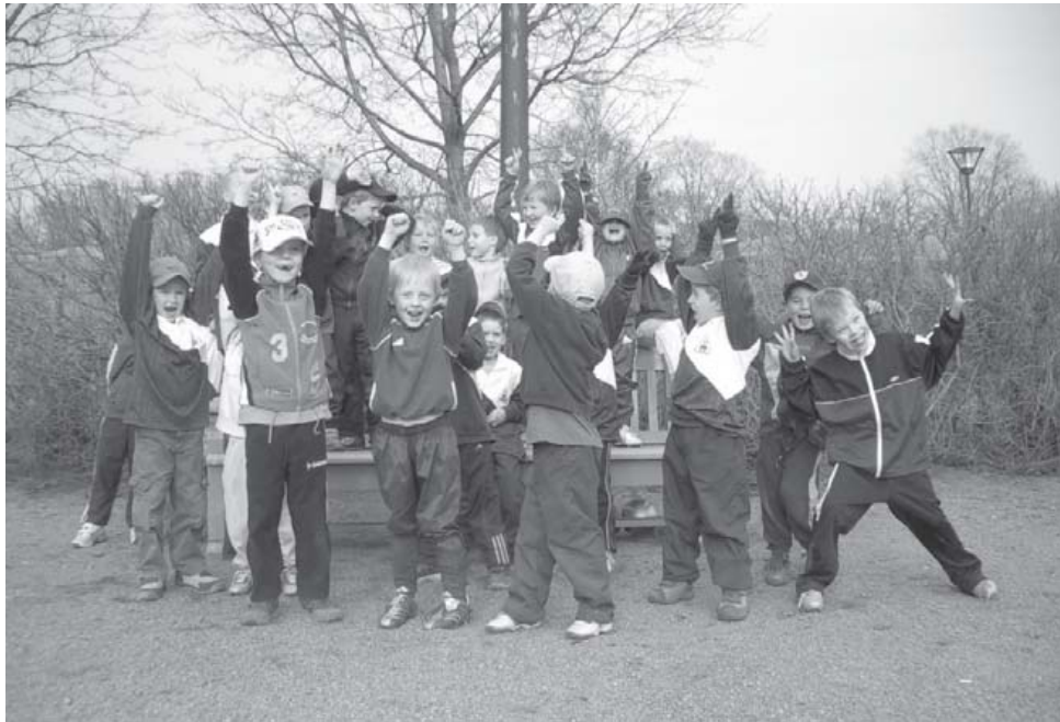
Kuvassa pojat ovat juuri nähneet punaisen kuumailmapallon...

Valmentaminen on joka kerta ihmeellinen kokemus. Omat työkiiret ja ulkomaailma häviävät samalla sekunnilla kun pilli soi. Pojat vaativat valmentajiltaan sataprosenttisen huomion, mutta tylsää ei kenelläkään ehdi olla. Hetkessä on yksinkertaisesti hyvä elää. On toki päiviä jolloin kaikki kengännauhat aukevat samaan aikaan, mutta useimmiten treenejä hallitsee nauru, joskus jopa hysteerinen kikatus. Etelä-amerikkalainen kirjailija Eduardo Galenano sai kerran kysymyksen miten hän selittäisi "ilo" -sanan merkityksen pienelle lapselle. Hän vastasi että hän ei selittäisi yhtään mitään, vaan antaisi lapselle pallon!