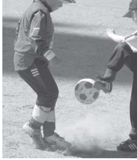
Kaksinkamppailut kuuluvat olennaisena osana jalkapalloiluun.